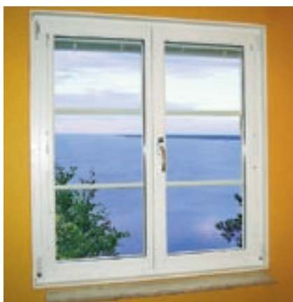
A – Kipp/Dreh-fönster i stängt läge.