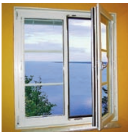
C – Kipp/Dreh-fönster i putsläge.