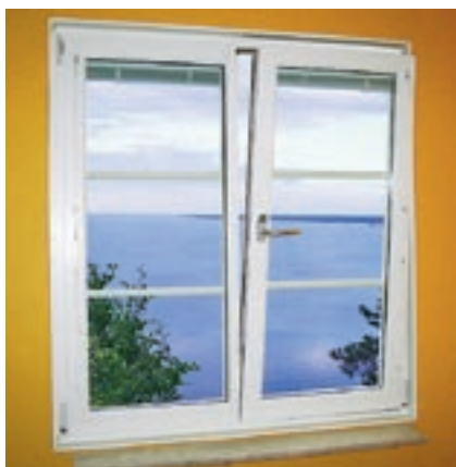
B – Kipp/Dreh-fönster i ventilationsläge.